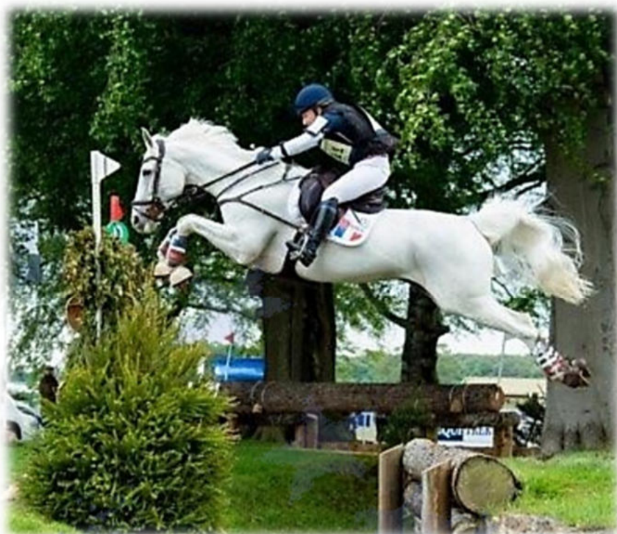
Championnat du Monde Eventing 2019 - UK

Communication innovante pour des retombées qualitatives et quantitatives sur nos supports dynamiques permanents, Une vision nouvelle et globale tournée vers l'avenir et ses succès